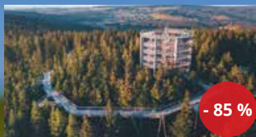
Stezka korunami stromů Lipno