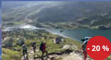
horské kurzy a treky KROKUDY