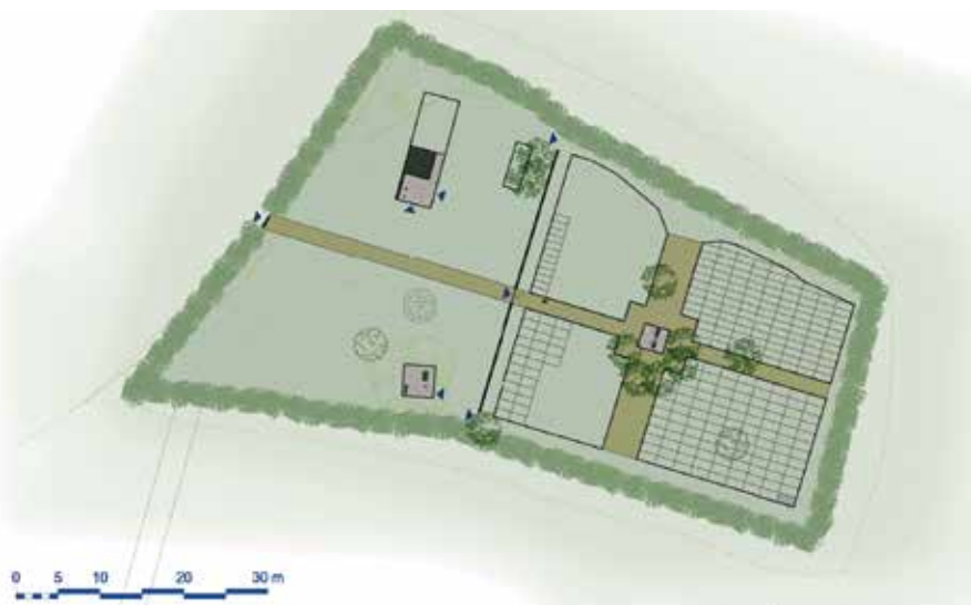
KONCEPT NÁVRHU REVITALIZACE

Na rekognoskaci hrobů, exhumaci ostatků a jejich převezení do vlasti se vedle OVVVH MO podílela řada badatelů, historiků a archeologů. Výrazně pomohla Kancelář