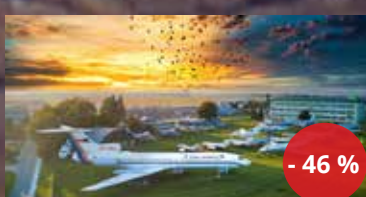
Letecké muzeum v Kunovicích