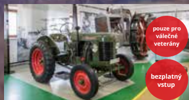
Národní zemědělské muzeum v Praze a dalších městech