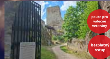
muzea, hrady a zámky v Jihomoravském kraji

Příjemně a zajímavě prožité léto vám přeje Benefitý pro vojáky a válečné veterány.