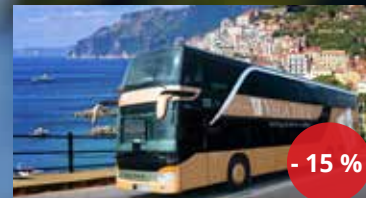
CK Vega Tour