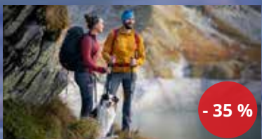
outdoorové vybavení Direct Alpine