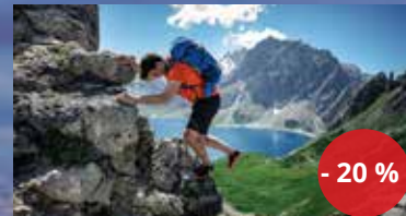
outdoorové vybavení HUSKY